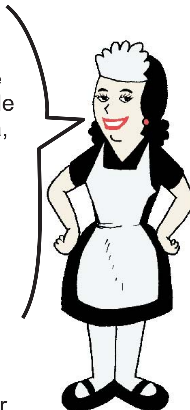
Quadro emprego doméstico no Brasil

Empregada doméstica é uma profissional e merece, como todo trabalhador, o direito a ter uma carteira assinada, aposentadoria, pelo menos um salário mínimo, horário de trabalho, segurança previdenciária, enfim respeito e dignidade.